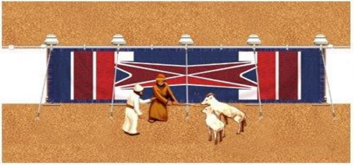
2 verschillende plaatjes (zie hierboven en hieronder) met het ROOD, WIT en BLAUW van de Poort van de Israëlitische Tabernakel